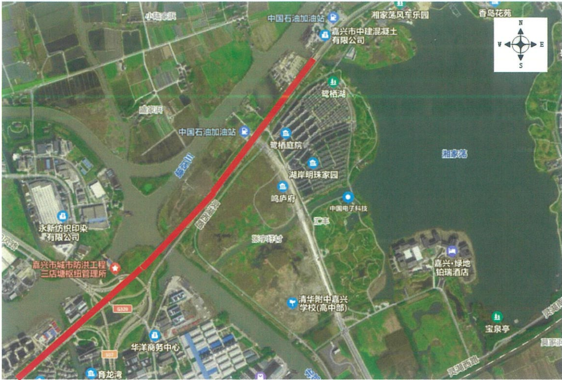
图2 周边环境概况图