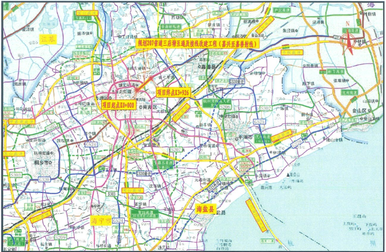
图 1 项目线路走向图